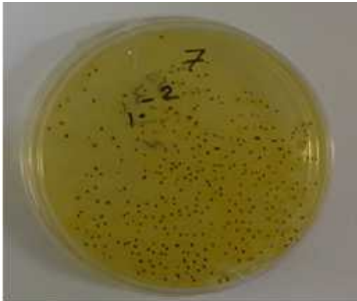
شکل ۱: یک نمونه پلیت قابل شمارش باکتری