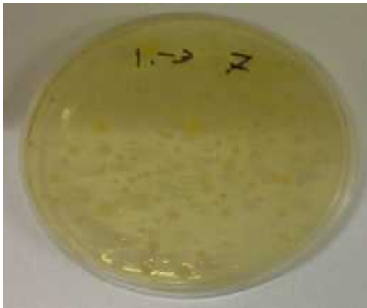
شکل ۲: کلونی‌های باکتریایی در بافت تازه روده به ترتیب در رقت‌های ۰/۱ و ۰/۰۱ در دمای ۳۷ درجه سانتی‌گراد

۰/۱ میلی‌لیتر از هر رقت در سطح پلیت حاوی محیط TSA ریخته و با استفاده از میله شیشه‌ای خمیده پخش گردید. پس از طی ۲۴-۴۸ ساعت زمان انکوباسیون با دمای ۳۷ درجه سانتی‌گراد، پلت‌هایی که دارای ۳۰-۳۰۰ کلنی بودند شمارش شدند و تعداد کلنی‌ها در عکس ضریب رقت ضرب شده و تعداد تقریبی باکتری‌های موجود در ۱ گرم نمونه محاسبه گردید (Karim, ۲۰۰۳). (CFU یا Colony Forming Unit)