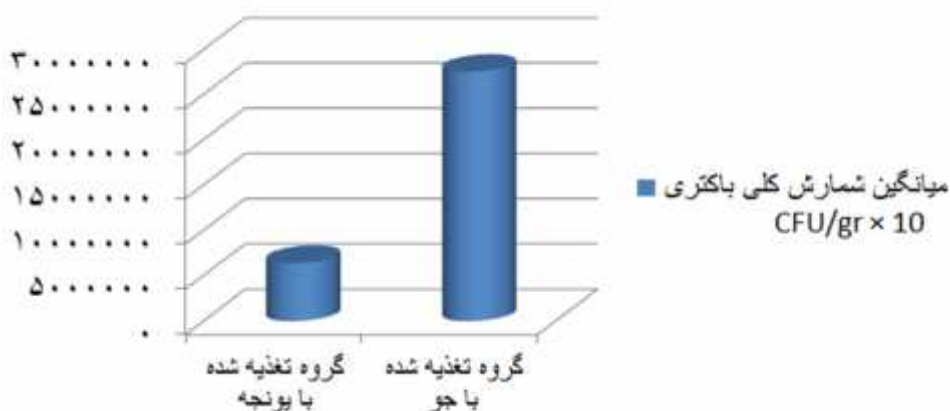
شکل ۳: نمودار ستونی مقایسه میانگین (M±SD) تعداد کل باکتری‌ها (CFU/gr) در یک گرم بافت تازه روده ماهیان کپور علفخوار تغذیه شده با جو و گروه تغذیه شده با یونجه

در گروهی که جو مصرف می‌کرد، باوجود کاهش قطر لایه عضلانی، قطر لایه مخاطی (شکل ۵) روده افزایش یافته بود. در هر دو گروه انتهای روده نسبت به وسط روده، تعداد سلول‌های موکوسی بیش‌تری مشاهده گردید. در بقیه موارد اختلاف معنی‌داری مشاهده نشد ( p > 0.05 ).