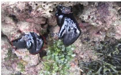
شکل 3: حضور P. nigra در بستر مصنوعی و رقابت با گونه‌های جلبکی

خونی برآمده مشخص می‌شود. نمونه‌ها می‌توانند به طول ۱۰ سانتی‌متر می‌رسند. این گونه در شمال جزیره - اسکله، در بسترهای مصنوعی (بقایای کشتی‌های فلزی)، در ناحیه جزر و مدی مشاهده گردید.