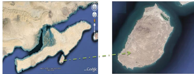
شکل 1: موقعیت جزیره هنگام در خلیج فارس